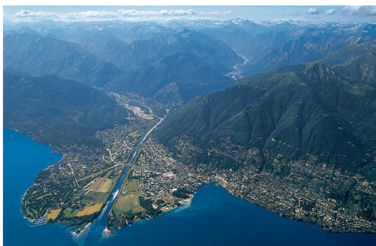
Veduta del Locarnese sulla sponda settentrionale del Verbano. Muralto si trova nell'insenatura formata dal delta del fiume Maggia.

Un secondo aspetto concerne la cultura materiale, e in particolare la ceramica d'uso comune, rilevata grazie allo studio sistematico della successione stratigrafica nel lotto Park Hotel 2. Questo approccio rappresenta una novità nell'area della Svizzera italiana e offre un quadro completo dei materiali archeologici dal punto di vista dei rinvenimenti d'abitato a partire dal periodo della romanizzazione. Da ultimo, la situazione di Muralto è contestualizzata nel quadro regionale e sovraregionale. Tra la fine dell'età del Ferro e l'età romana si osserva uno spostamento del baricentro della regione dall'entroterra verso le rive del lago. Muralto diventa capoluogo di una regione occupata da insediamenti a carattere rurale e punto strategico sulla via di transito fluviolacuale che collega la pianura padana alle aree transalpine.