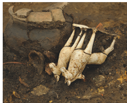
Vierherrenplatz, Grab 292. Urne mit Pferdepaar aus Terrakotta.

in den topographischen Kontext bringen. In unmittelbarer Nähe der römischen Kleinstadt wurden in den letzten Jahren noch zwei weitere Gräberfelder – aber nur mit wenigen Individuen – geborgen. Es stellt sich die Frage, wie sich die Gräberfelder zeitlich und räumlich in der Siedlungslandschaft situieren. Die Analyse der demographischen und sozialen Verteilung wird durch die anthropologische Untersuchung in Zusammenarbeit mit der Universität Tübingen angegangen.