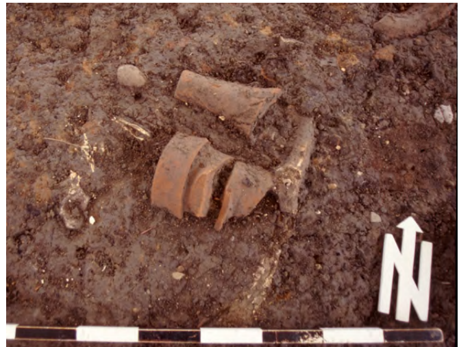
Damals wie heute: Abfälle und wie sie entsorgt werden, sagen viel über die Bewohner und Bewohnerinnen einer Siedlung aus.